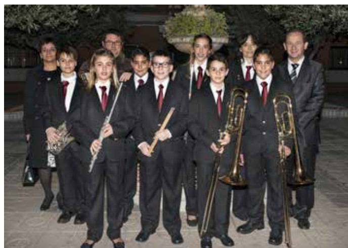
Celebració de Santa Cecília a la Societat Joventut Musical amb l'entrada de nous músics.