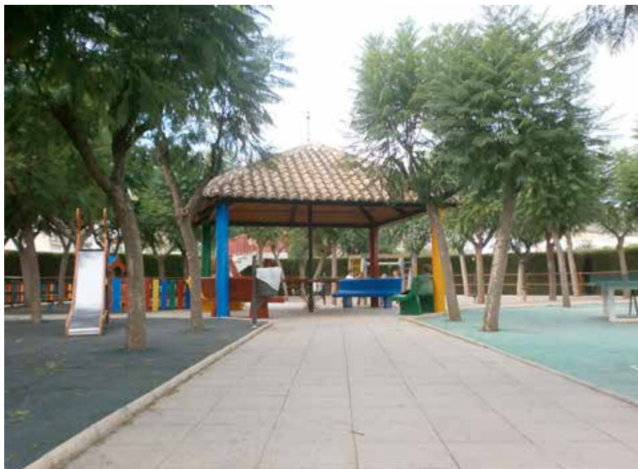
Parc de la Canaleta, on es faran remodelacions durant aquest any.

Una altra de les obres que es materialitzarà en els pròxims mesos serà l'obertura de la prolongació del carrer Blasco Ibáñez a la Canaleta. Un projecte que està en el paper des de fa més de 60 anys i que serà realitat en breu. I durant el primer semestre de 2014 conclouran les obres de l'accés per als vianants a la rotonda de la CV-320. A més, el Consistori destinarà 40.000 euros al acondicionament de