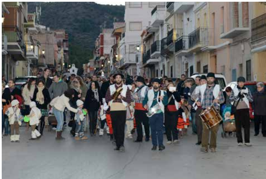
Cercavila de pastorets i pastorettes pels carrers del poble.

A més, per a amenitzar uns dies tan especials, els músics locals van organitzar concerts, audicions o passacarrers en els que no van faltar les tradicions nadales.