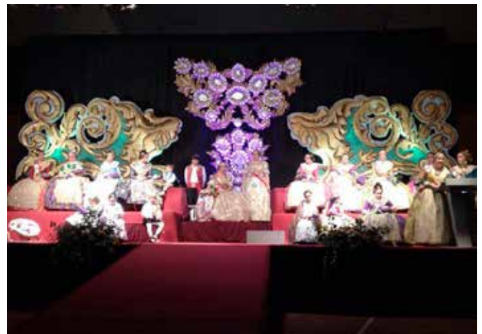
Acte de presentació de la Falla Vila de Faura al pavelló.