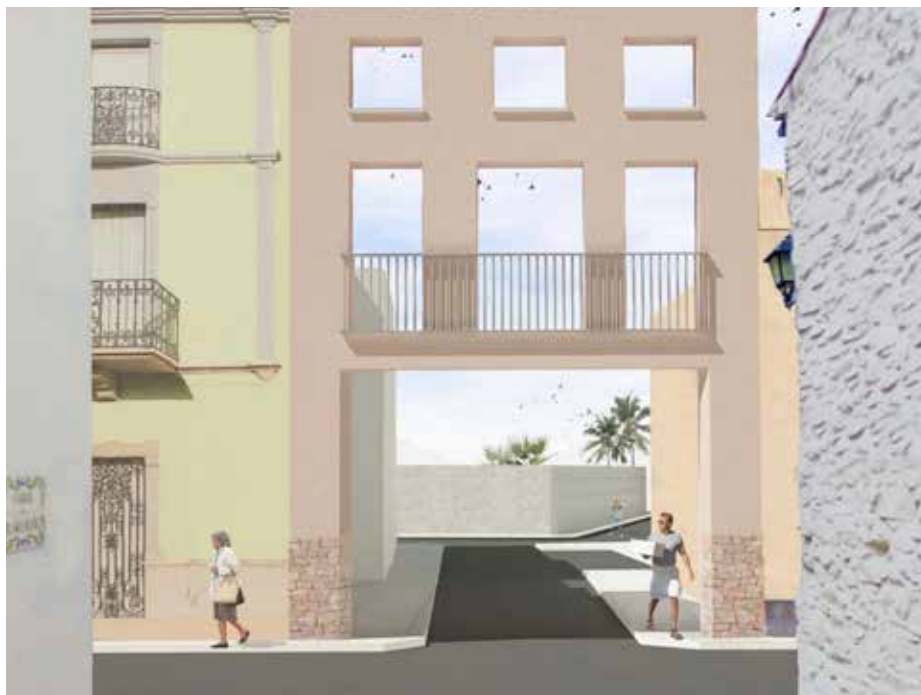
Esbós de l'obertura de la prolongació del carrer Blasco Ibáñez a la Canaleta.

carrers del municipi i a altres actuacions de menor envergadura.