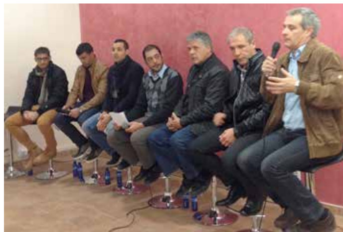
Xarrada amb primeres figures organitzada pel Club de Pilota de Faura.