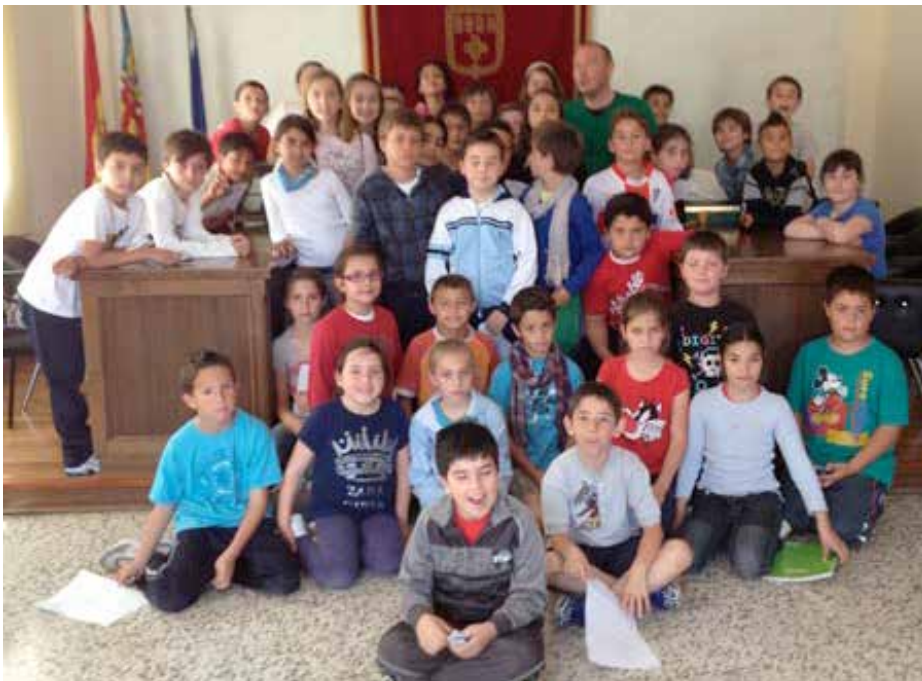
Recepció en l'Ajuntament d'un grup d'alumnes del col·legi.

- Se m'han passat tan ràpid els deu anys, em passen tan ràpid els dies que a voltes no sóc conscient que ha transcorregut tot eixe temps. Encara no he arribat a la fase de pensar en açò. Em sent orgullós del poble. Em sent orgullós de la seua gent, de les coses que han sigut capaces d'engegar. La política serveix per a fer la vida una mica més fàcil i en aquest poble