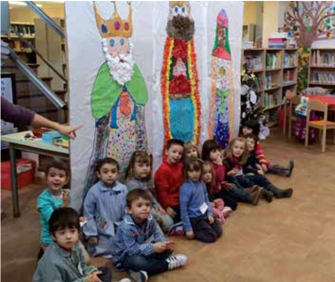
L'escola de Nadal ha sigut tot un èxit .