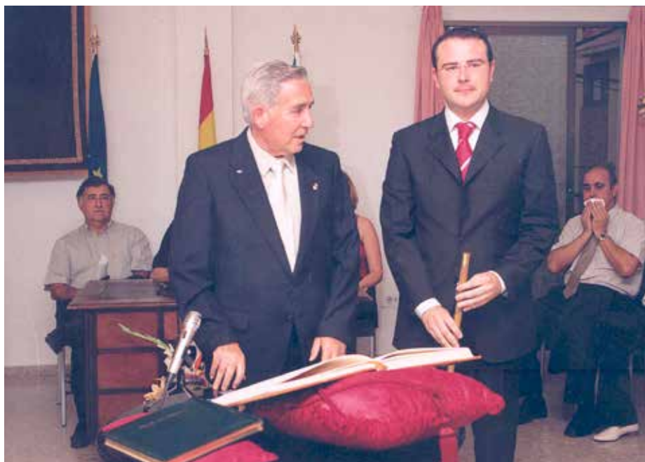
Acte de presa de possessió del càrrec després de les eleccions de 2003.

- Solament amb la competència educativa que li correspon a la Generalitat i que està assumint l'Ajuntament estem prop dels 100.000 euros anuals. Però no és solament que no ho posa sinó que a més ens continua devent diners d'altres coses que no paga. És de bojos. La gestió dels governs del PP en