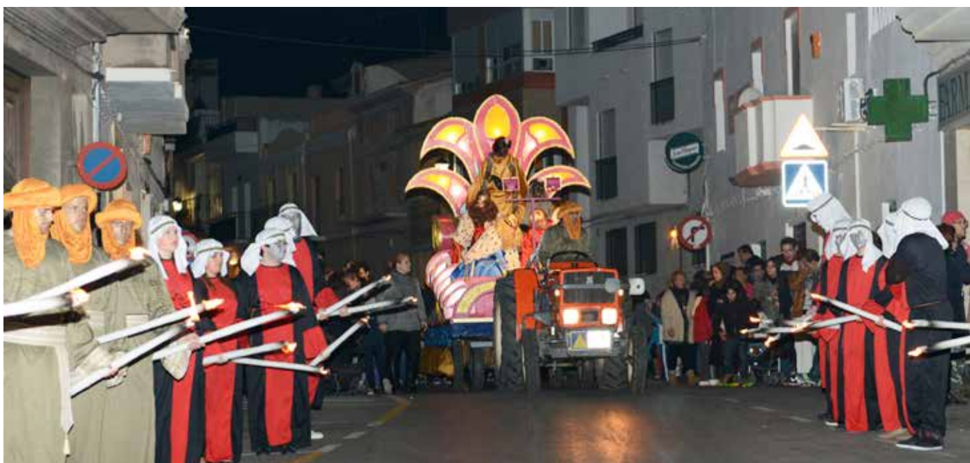
La Cavalcada de Reis va comptar amb una nombrosa assistència en el seu recorregut des de l'ermita a la plaça Mestre Enric Garcés.