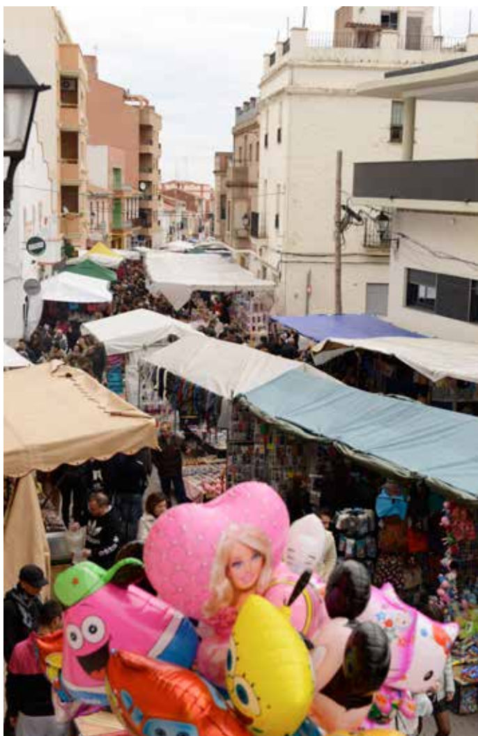
Un dels carrers que va quedar convertit en un aparador en la Fira.