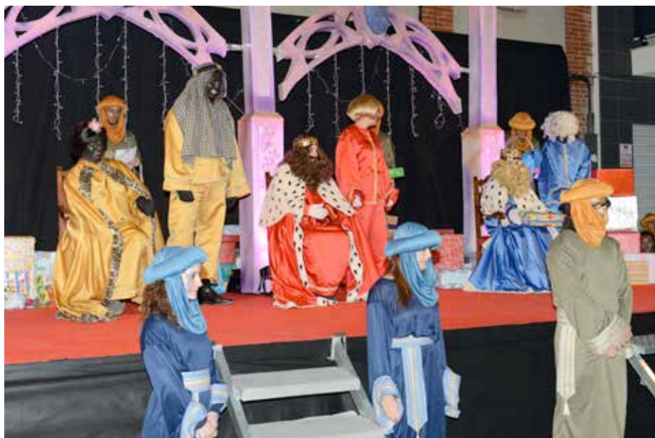
Els Reis d'Orient fan entrega d'un regal als xiquets de Faura.

Tot açò succeïa mentre centenars de veïns desfilaven pel Llavaner per a visitar el betlem o gaudien de la decoració dels aparadors nadalencs dels comerços locals que van participar en la II edició del Concurs d'Aparadors emmarcat dins de la campanya de promoció del comerç local engegada per l'Ajuntament.