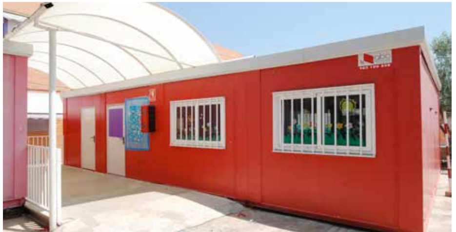
Barracons instal·lats en el col·legi públic del municipi.

Des de l'equip de govern esperen que la solució per al col·legi de Faura no