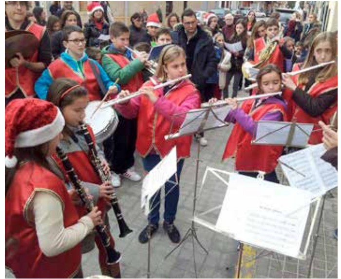
Ronda de nades pels alumnes de l'Escola Joan Garcés Queralt.